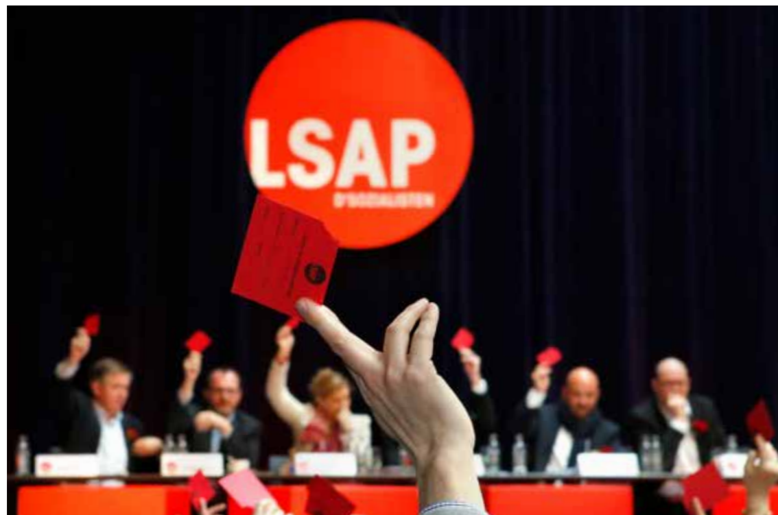
Der sozialistische Leitfaden wurde auf dem LSAP-Landeskongress am 20. März 2016 einstimmig angenommen.

Im Gegensatz zu Wahl- und Koalitionsprogrammen, die maßgeblich politische Vorhaben und konkrete Forderungen für die darauffolgende Legislaturperiode im Blick haben, hat der sozialistische Leitfaden den Anspruch, Parteimitgliedern und sozialistischen Entscheidungsträgern eine längerfristig ausgerichtete Anleitung mit klaren Richtlinien für ihr politisches Wirken anzubieten. Gleichzeitig geht es darum, das Profil einer verantwortungsbewussten linken Volkspartei nach außen hin zu schärfen, um verlorengegangenes Vertrauen durch das Aufzeigen von klaren Leitlinien und politischen Zielsetzungen zurückzugewinnen.